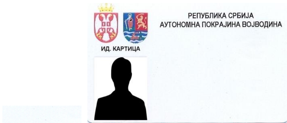
Изглед идентификационе картице покрајинских службеника

в) Изглед идентификационих обележја запослених у органу који могу доћи у додир с грађанима по природи свог посла или линк ка месту где се она могу видети: